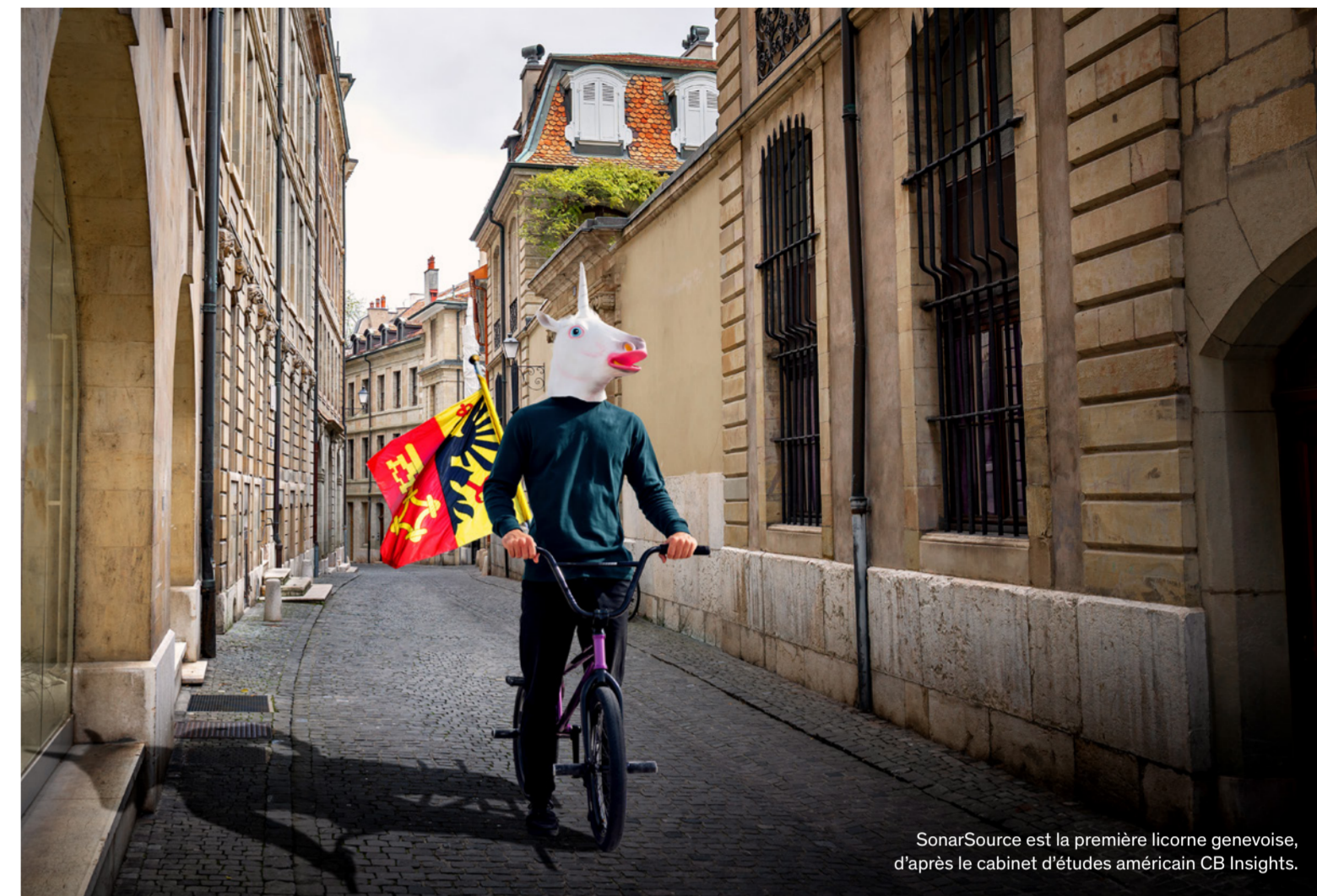
SonarSource est la première licorne genevoise, d'après le cabinet d'études américain CB Insights.